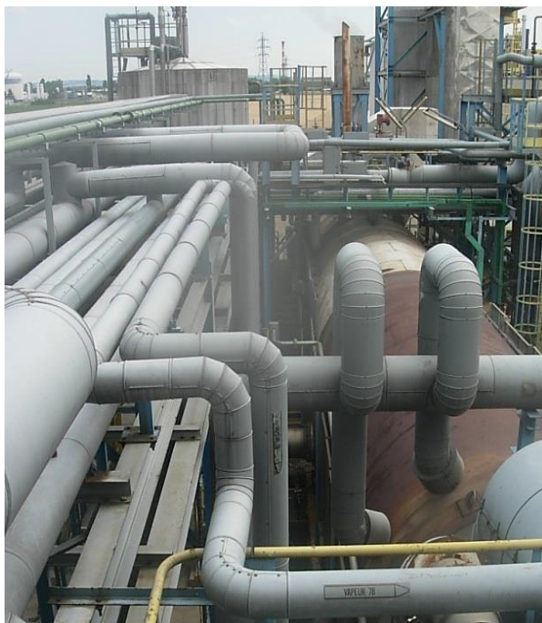
Etude de réseaux chauds en raffinerie