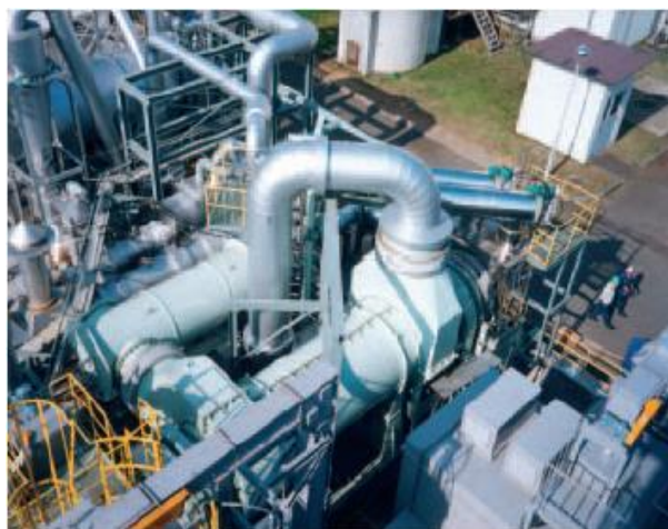
Unité de pyrolyse de déchets ménagers (1 t/h)

→ GEOCYCLE : Unité de valorisation de déchets à associer à un four de cimenterie : assistance à maîtrise d'ouvrage