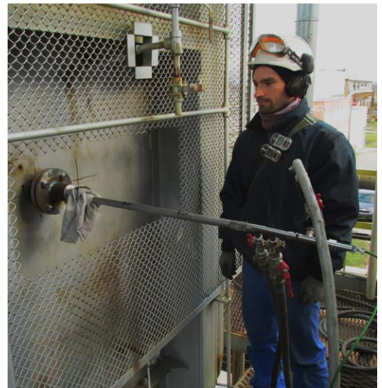
Mesure de température dans une chambre de combustion au pyromètre à aspiration sur un four