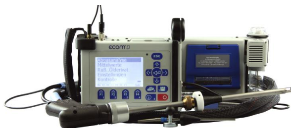
Analyseur de fumées