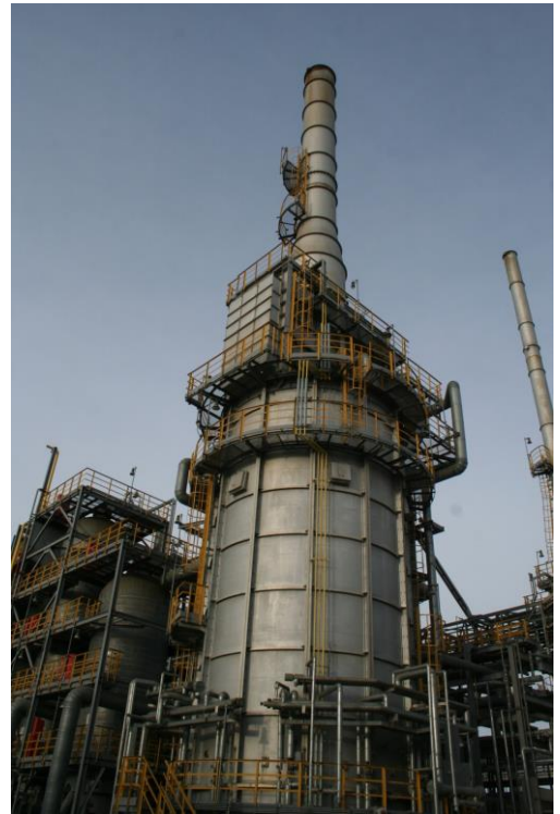
Four de raffinerie audité par ATANOR