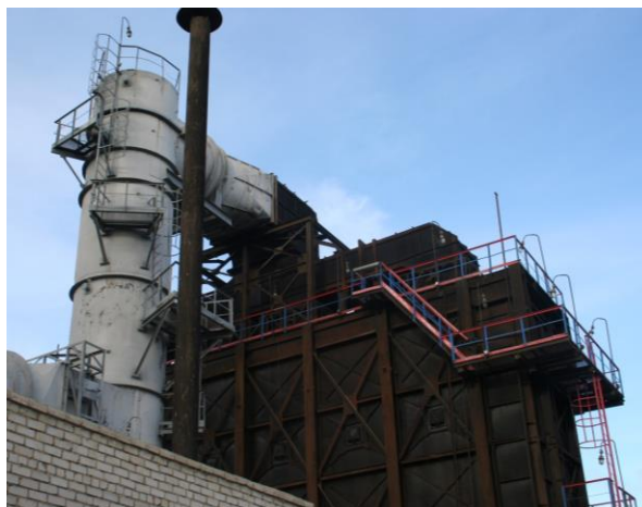
Four industriel audité par ATANOR